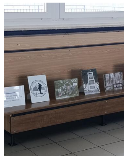
Fot. Działania edukacyjne przeprowadzone w ramach podsumowania projektów.