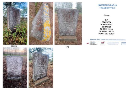
przykładowa dokumentacja zdjęciowa

Rezultat końcowy: zinwentaryzowano 82 cmentarze.